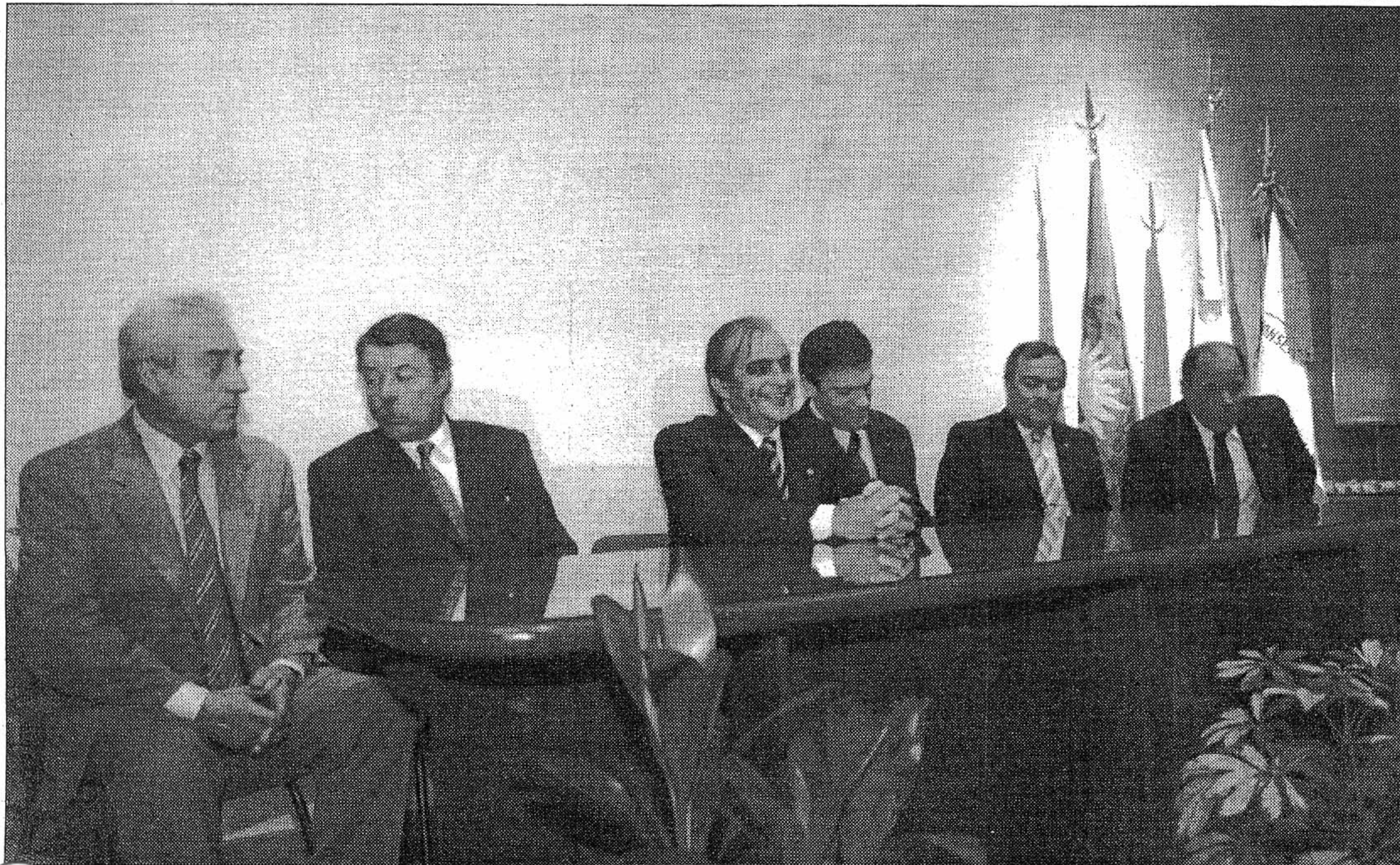
Consejo Profesional de Ciencias Económicas realizó anoche un acto para celebrar el aniversario.